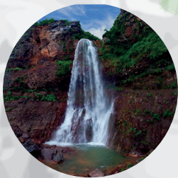
Г. ИЛЬЯ МУРОМЕЦ